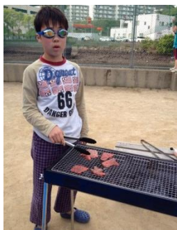
水泳界の未来を背負って立ちそうな雰囲気H君

周囲の人たちの頭上に？マークが浮かぶ中、急いで部屋からゴーグルを取ってきて、みんなの前でおもむろに装着！そして、もう、これで目にしめないとしつくりと火おこしに専念するH君でした。