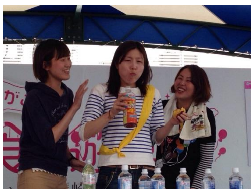
プライバシー保護のため、本人と違う写真を貼っているかもです？！

カステラ早食い選手権は、個人戦と3人が1チームの駅伝戦があります。お姉さんたちは、個人戦はちよつと恥ずかしいかも：と、駅伝の方に登録しました。そのチーム名は、『MJE48』チームのキャッチフレーズは、「私たちのことは嫌いでも、カステラは嫌いにならないでください！」