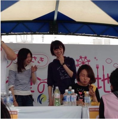
何度も言いますが、本人とは、 関係ない写真かもです！

N姉さん「うん。美味しか ったから、OK、OK！」 とN姉さんとT姉さんが、 ほくほく顔で試合を振り返 っている中、カステラにあ