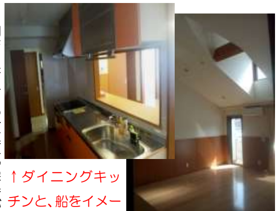
↑ダイニングキッチンと、船をイメージした天窓です→

さらに、ダイニングキッチン。キッチンは、安全なIHクッキングヒーターに、たくさん洗える大きなシンクがあります。そして、電