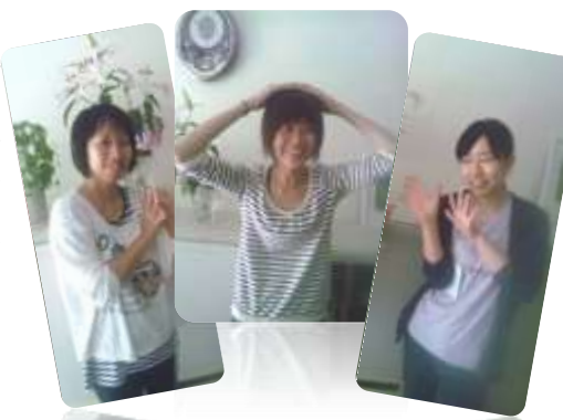
左から、のりこ姉さん、松尾姉さん、松本姉さんです。

さてさて、今年、明星園に新しく入った職員は3人のお姉さんです。早速インタビューをしていきたいと思ひます。