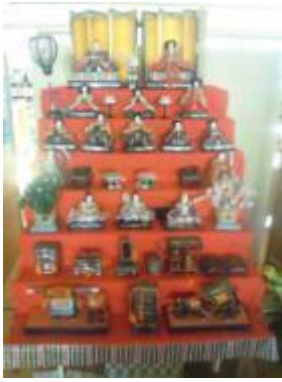
美しいひな人形にねずみが！