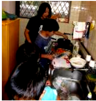
馬場グループのご飯作りは大混乱！

場所は、2階の保育室の横です。昨年までセルフサポートホームとして、高校生が自立するために生活していました。そこを家庭の雰囲気が出るようにいろいろとリフォームをして「わがや」として、生まれ変わったのです。