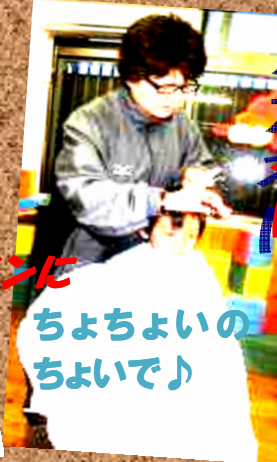
ちよちよいのちよいで♪