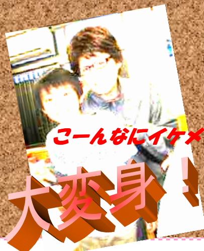
こーんなにイケメンに