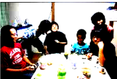
のんびり、まったく「わがや」の様子

そうそう、こんなこともありました。日頃お手伝いをしないようなあの子、そして、なんと「あ、あの子までもが、バリバリお手伝いしてくれるのです。お手伝いが終わった後、いつもと様子が違うあの子を心配したT姉さんは、おでこの熱を測っていたそうです。